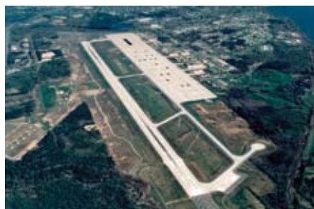
Une piste de 12 000 pieds, ancrée solidement dans une terre de 1,5 million de pieds carrés, où l'on peut se poser sans restriction.

Les résidents de Plattsburgh ont toujours été fiers de leur aéroport, particulièrement au temps où des centaines de militaires et leurs familles l'occupaient. L'Air Force Base de Plattsburgh joua un rôle crucial dans la défense aérienne du nord-est des États-Unis. De vieux bombardiers à jamais cloués au sol sont soudés sur des socles pour entretenir le souvenir.