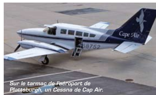
Sur le tarmac de l'aéroport de Plattsburgh, un Cessna de Cap Air.

« Dès ce moment, nous voulions profiter de ces installations pour y développer un aéroport commercial. L'US Air Force, Washington et l'État de New