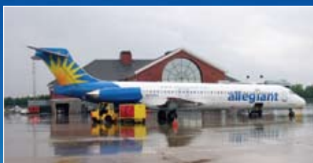
Le contrôle du trafic aérien de Plattsburgh est assuré par Burlington. La vieille tour de contrôle qu'utilisaient les militaires autrefois n'est plus en usage. Mais au pied, un immeuble a été aménagé pour accueillir le personnel et les passagers des vols d'affaires.